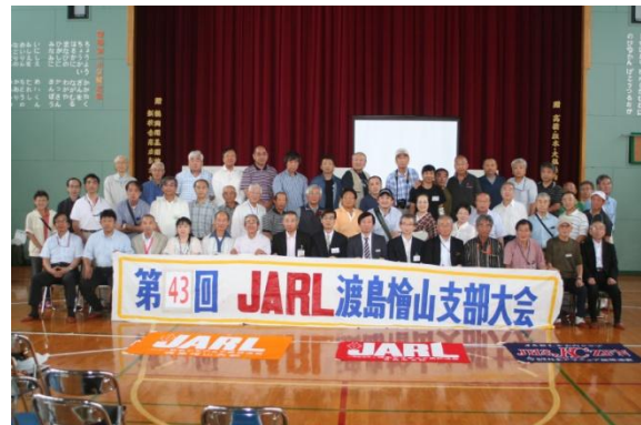
第43回 JARL 渡島檜山支部大会 平成28年9月4日